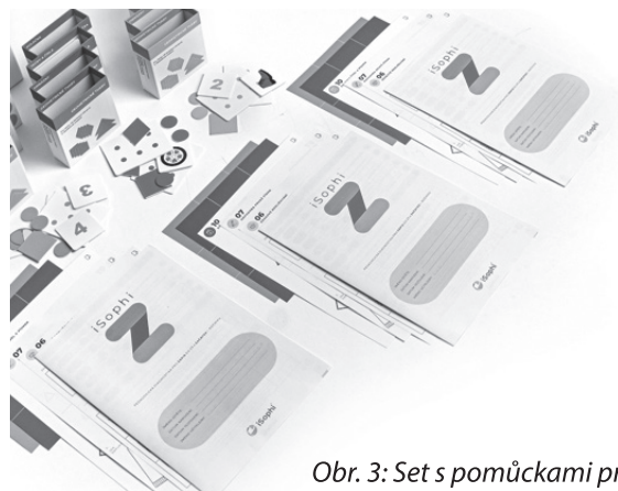
Obr. 3: Set s pomůckami pro 3 učitele

Pro systém byla vytvořena kvalitní digitální nadstavba, která je součástí nástroje. Ta umožňuje automatické