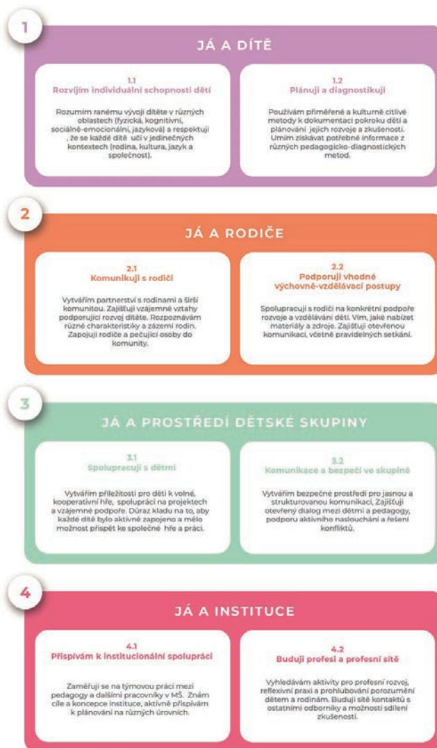
Kompetenční rámec autoevaluačního nástroje

Od září 2024 je tedy k dispozici nový, revidovaný Nástroj profesního sebepoznání. Na základě statistických výsledků byla finalizována skladba výroků a složení kompetencí. Nástroj v podobě aplikace je aktuálně volně dostupný na webových stránkách www.podporapedagoga.cz všem pedagogickým pracovníkům MŠ, kteří mají zájem na sobě pracovat a posouvat se ve své profesi.